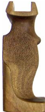
Handgabel zu schmal