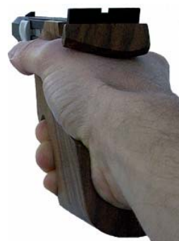
Hintere seitliche Anlage zu dick