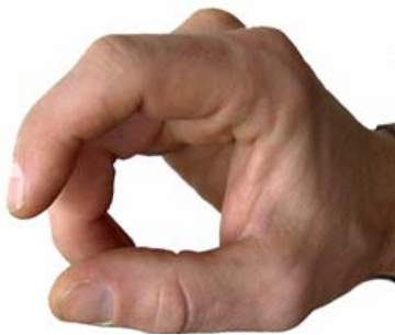
Blick von oben in die Hand zum Handballen