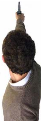
Visierlinie von hinten