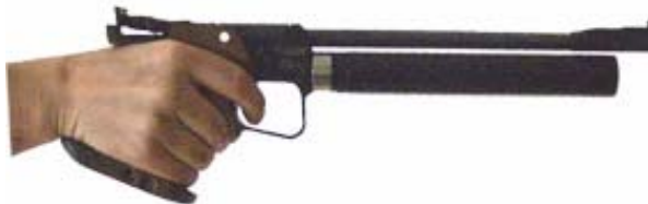
Handauflage optimal / Luftpistole