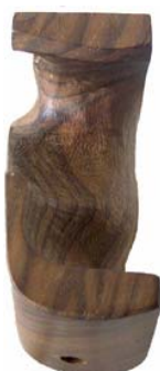
Hintere seitliche Anlage zu dick Handgabel schmal (li.), zu breit (re.)