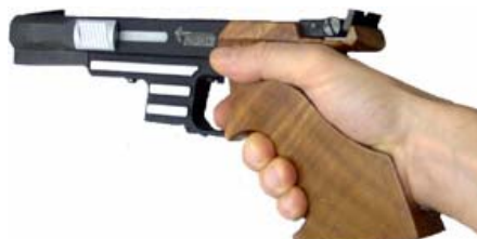
Griff zu groß - Finger und Handrücken haben zu viel Luft Daumen liegt zu hoch