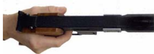
Zeigefinger natürlich gekrümmt