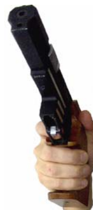
Finger haben zu viel Luft und greifen zu weit um den Griff