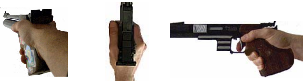
Daumen und Zeigefinger haben ca. gleiche Höhe und liegen parallel am Griff