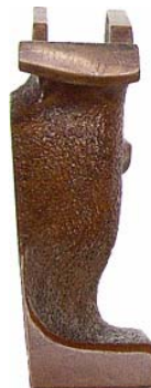
schmale seitliche Anlage für Handballen optimal