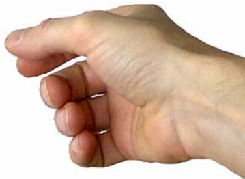
Blick seitlich von hinten