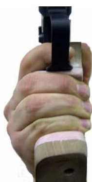
Finger liegen nicht mittig zum Abzug Handballen hat zu wenig Platz im Griff