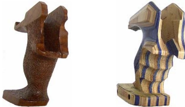
Handballen hat viel Platz im Griff