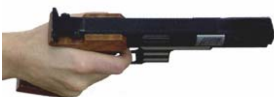
beim Zeigefinger sind die ersten Glieder frei