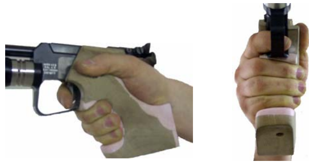
Mittelfingerauflage optimal/ Mittleren Fingerlieder 90° zum Lauf und mittig zum Abzugszüngel