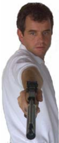
Visierlinie von vorne