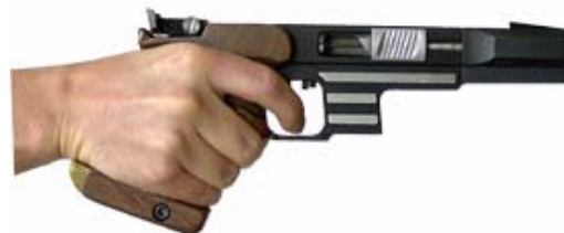
Handauflage optimal / Sportpistole