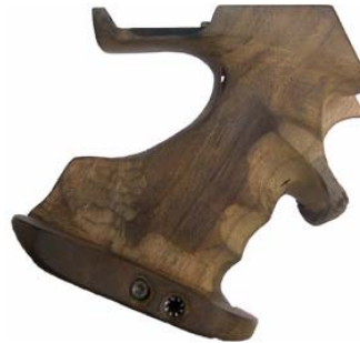
Handauflage kopiert und zwei Schrauben befestigt