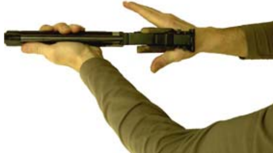
Pistole mittig in die Hand setzen