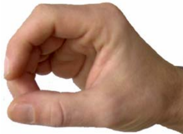
Blick seitlich von oben