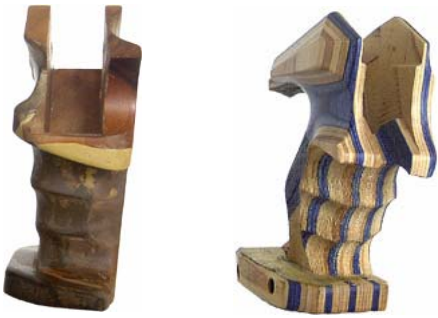
schräge Auflagefläche für Mittelfinger / leichte Konturen für die Finger