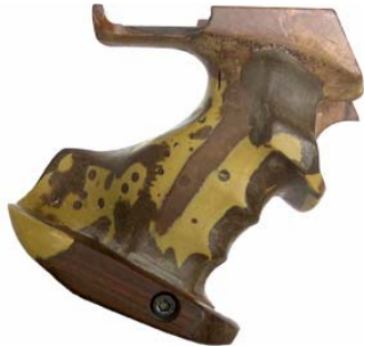
Handauflage mit Holzkitt verlängert