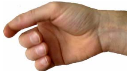
Blick von der Seite