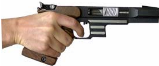
Handauflage zu kurz / Sportpistole