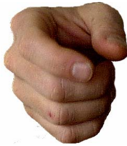
Blick von vorne